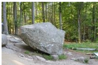
Rokkestenen i Paradisbakkerne

Ønsker man ikke at komme til Natur Bornholm kan man som alternativ besøge Rønne by eller Bornholms Rovfugleshow .