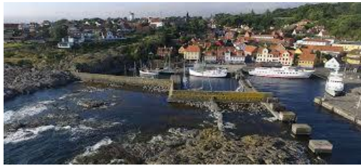
Udsigt over Gudhjem

Turen starter med at vi kører til Østerlars Rundkirke , Bornholms største rundkirke. Herfra videre til Gudhjem, en af Danmarks smukkeste beliggende byer. Her bliver der et ophold, til at se byen på egen hånd. Derefter videre til Helligdomsklipperne, her gøres ophold hvor der er mulighed for at spise den medbragte mad samt se klipperne og ”den sorte gryde”. Turen fortsætter videre igennem Tejn, Sandkås og tvillingebyerne Allinge-Sandvig til Hammershus slotsruin, hvor der er ophold for at se på borgen. Herfra videre til Vang hvor der er mulighed for at vandre til Jons Kapel. Derefter går turen hjemad, forbi Ruts Kirke igennem Klemensker, Årsballe, Østerlars og Østermarie.